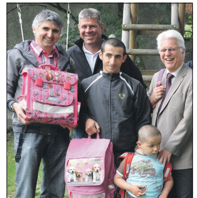
LR GERHARD REHEIS ist stolz auf das erfolgreiche Team.

Zum Schulende werden wieder in vielen Tiroler Schulen und bei allen Recyclinghöfen gebrauchte Schultaschen für Kinder im Kosovo und in Bosnien gesammelt. Diese werden wie in der Vergangenheit von Asylwerbern des Flüchtlingsheimes Reichenau in Innsbruck gereinigt, sortiert und mit einer Grundausrüstung von Schulmaterialien befüllt. Das Land Tirol startete bereits 2008 in Zusammenarbeit mit dem Rotem Kreuz, dem Jugendrotkreuz und dem Umweltverein Tirol unter Leitung der Abfallwirtschaft Tirol Mitte/ATM diese Sammelaktion, die mittlerweile 5000 Schultaschen für bedürftige Kinder im In- und Ausland erbracht hat. „Die Aktion gerade jetzt zum Schulende ist deshalb wichtig, damit diese Ausrüstung rechtzeitig zum Schulbeginn im Herbst an ausgewählten Schulen im Kosovo und in Bosnien zur Verfügung steht“, sagt LR Gerhard Reheis. „Ich bedanke mich ausdrücklich bei den Asylwerberinnen und Asylwerbern im Flüchtlingsheim Reichenau für ihre tatkräftige Unterstützung.“ Verbunden damit ist die Einsparung von Tonnen von Abfall, der anfallen würde, wenn diese noch funktionsfähigen Schultaschen im Müll