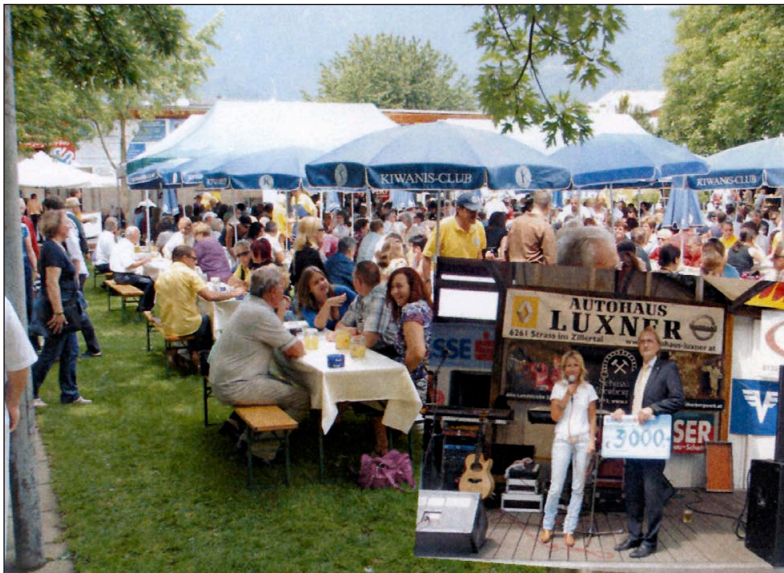
HOHER BESUCHERANDRANG beim Vatertagsfest des Kiwanis - Clubs Schwaz beim Postpark.