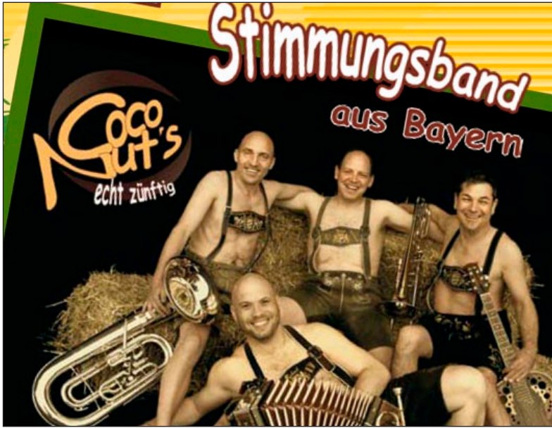
COCO NUT'S - Stimmungsband aus Bayern.